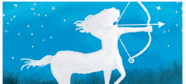
Illustration: Yoko Ogre

Text: 華月 鈴 (カゲツ・リン) | 北海道札幌出身。占い歴20年以上。FMラジオや雑誌等多岐にわたる活動を展開している。現在占い師の育成に力を注いでいる。