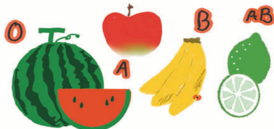
Illustration: Yoko Ogure

Text: 華月 鈴 | 北海道札幌出身。占い歴20年以上。FMラジオや雑誌等多岐にわたる活動を展開している。現在占い師の育成に力を注いでいる。