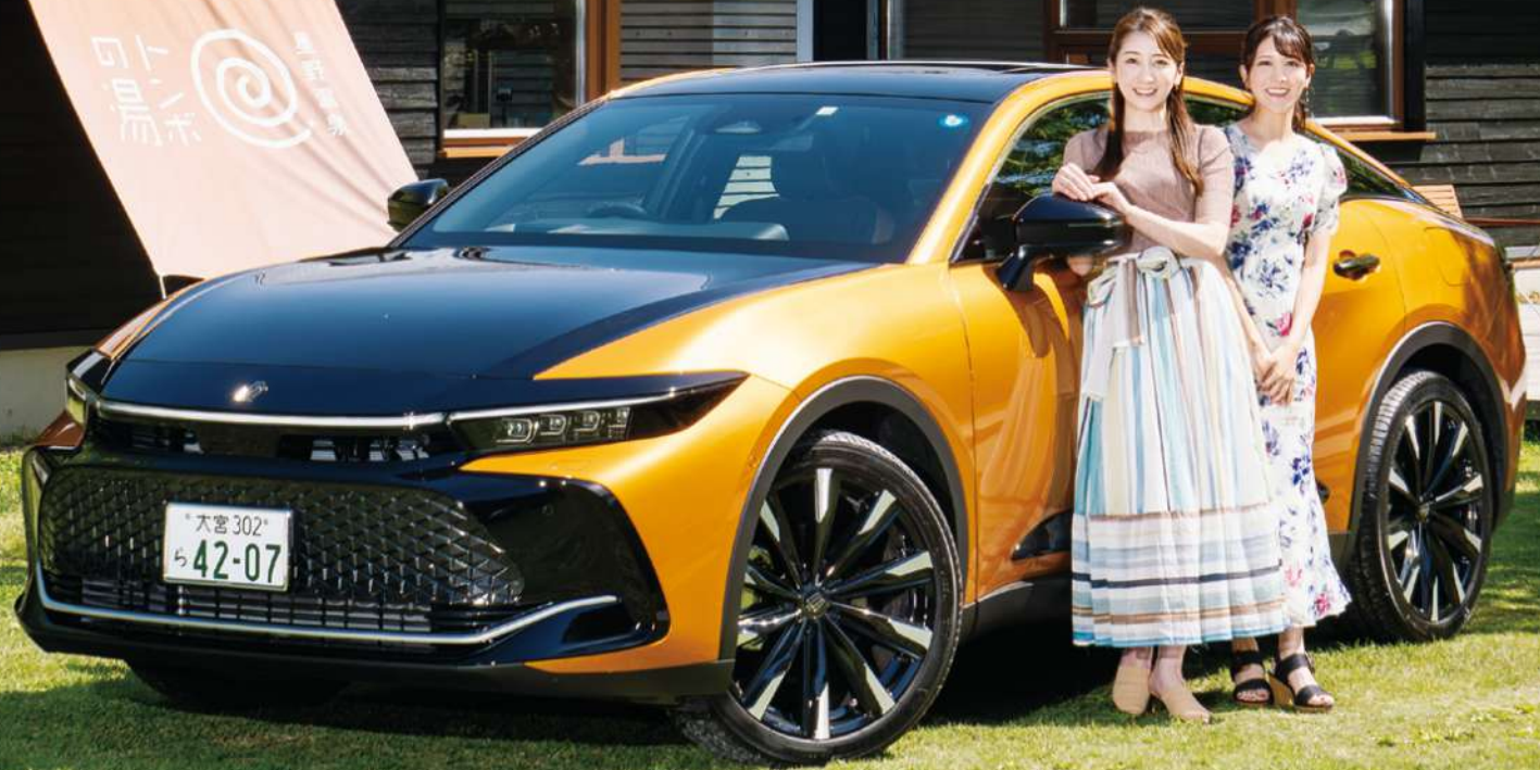
撮影地：星野温泉 トンボの湯