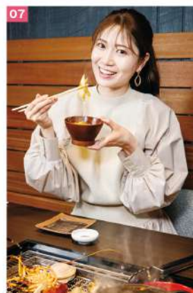
海山の高級食材が集合 どれからいただく!?

01 定置網漁ならではの、鮮度の高いお魚を中心としたお造り。季節に応じた色とりどりのツマが、お造りをいっそう映えさせます。 02 食事は、ヴィア内のキッチンでいただきます。プランによっては本館で季節の会席料理をいただいたり、近隣や館山の飲食店を紹介してもらうことも可能。 03 伊勢エビにアロビ、ハマグリと海鮮好きにはたまらないラインナップ。 04 取材日のお鍋は、館山かんべれタスと東の匠豚でした。1978年から続く最高峰ブランド豚の味は格別です。 05 色とりどりの地野菜をバーニャカウダで。どのお野菜も新鮮なので、あたためたソースをちょっとつけるだけでおいしくいただけます。 06 取材日のデザートは、千葉ならではのおいしいいちごと水菓子のプレート。四季に応じた内容がうれしいですね。 07 プライベートキッチンで、リラックスしながらいただく夕食は格別です。