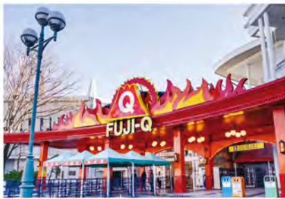
「SHOP FUJIYAMA」は、第1入園口近くにある園内最大のショップ。オリジナルグッズはもちろん、山梨県の名産品や銘菓も数多くそろえ、甲州産のワインショップも併設。

ランド」や「リサとガスバールタウン」などのテーマパークが用意され、老若男女を問わずに1日中楽しむことができます。2018年には、入園料が無料化されたほか、年間フリーパスも大幅値下げされ、ますます訪れやすくなりました。今後は、新規に大型コースターの導入を予定していて、ますます目が離せません。