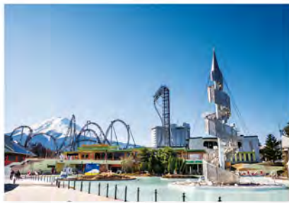
富士急ハイランドの魅力のひとつは、富士山の雄大な姿を園内の各所から楽しめること。最も美しいとされる北麓側の姿は、まさに優美のひとつです。