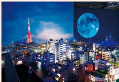
「美少女戦士セーラームーン」の舞台である1990年代の「麻布十番の街」を再現したエリア。街の中には、作品に登場するキャラクターの姿も。