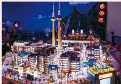
アジアの街並みをモデルにした架空の街。建物ひとつひとつが精巧に作られています。朝と昼、夜、それぞれの景色を楽しんで。