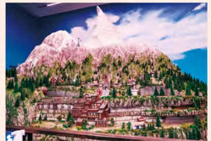
ガリバートネルを抜けて3階メインフロアへ。そこは、1日が15分サイクルで回っています。「世界の街」エリアには、既視感のある風景にファンタジーが散りばめられた街並が広がります。

滑走路や空港内の店舗まで、関西国際空港を再現したエリアには、約40機の機体を配置。機体は、誘導灯に沿って移動したり、離発着します。離発着時に響く、大きなエンジン音などもリアルで、まるで空港にいるような体験ができます。