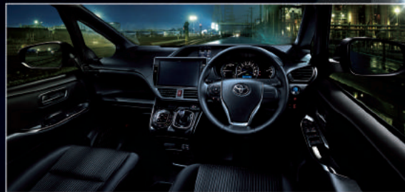
Photo:ヴォクシーHYBRID ZS。内装色はブラック。ボディカラーのインズマスパーキングブラックガラスフレック(224) [32,400円]、ワンタッチスイッチ付デュアルパワースライドドア [61,560円]、SRSサイドエアバッグ+SRSカーテンシールドエアバッグ [48,600円] はメーカーオプション。ナビゲーションシステム(T-Connectナビ10インチモデル [312,120円]) は販売店装着オプション。価格には含まれておりません。■写真は機能説明のために各ランプを点灯したものです。実際の走行状態を示すものではありません。

★燃料消費率は定められた試験条件のもとでの値です。お客様の使用環境(気象、渋滞等)や運転方法(急発進、エアコン使用等)に応じて燃料消費率は異なります。