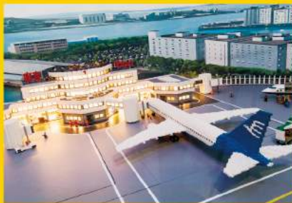
東京国際空港のジオラマ。「ミニランド」内の日が暮れると、ターミナル内に明かりが灯り夜の空港の雰囲気に。働く人やデッキで見送る人など、多くのフィギュアにも注目です。