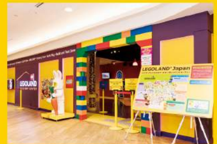
お出迎えしてくれる大きなフィギュアと鮮やかな黄色が目印の入口。デックス東京ビーチアイランドモール（3階）は、ゆりかもめ線「お台場海浜公園駅」から徒歩2分です。

レゴランド・ディスカバリー・センターで使用しているレゴ®ブロックの数は300万個以上！まずは工場見学でブロックの製造工程を探検しよう！遊具で溶解や色つけなどを体験できます。