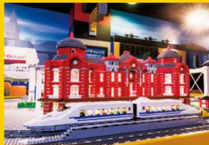
レゴ®ブロックで自由に電車を作って街中を走らせることができる「レゴ®シティレインワールド」。東京・大阪・上海をイメージした色彩豊かな街も魅力的！