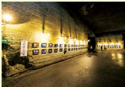
坑内で撮影された作品を展示する常設展。職人たちが仕事をした空間は、アーティストたちに受け継がれ、現在では映画の撮影やコンサートなど様々な情報発信の場となっています。