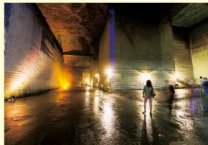
美しいライトアップと、所々差し込んでくる外からの光が幻想的な空間を演出しています。坑内は地下30m以上、年平均気温8℃前後でひんやり。