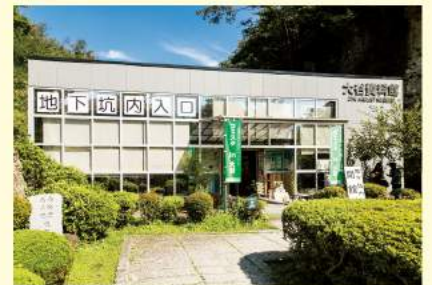
資料館の入口は日常から非日常へと続く扉。ここから長い階段を降りていくと、地下採掘場跡に辿り着きます。