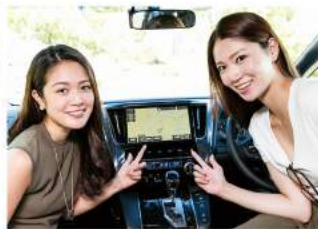
16モデル大画面10インチナビは、新採用の高精細HDディスプレイをはじめ、最新鋭のナビ機能をフル搭載。