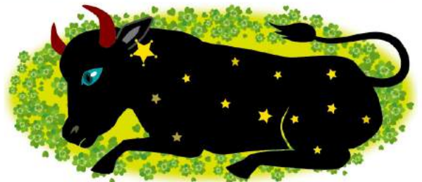
Illustration: Yoko Ogre

Text: 華月 鈴 (カゲツ・リン) | 北海道札幌出身。占い歴20年以上。FMラジオや雑誌等多岐にわたる活動を展開している。現在占い師の育成に力を注いでいる。