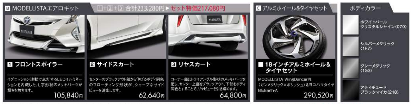
Photo: Aプレミアム“ツーリングセレクション”(2WD)。ボディカラーのホワイトパールクリスタルシャイン(070) [32,400円]はメーカーオプション。(価格には含まれておりません。)販売店オプションのモデルスタパーツMODELLISTAエアロキット、ICONICガーニッシュセット、LEDトップノットアンテナ、ドアハンドルガーニッシュ、18インチアルミホイール&タイヤセット(MODELLISTA WingDancerⅦ〈ガンメタリック×ポリッシュ〉&ヨコハマタイヤ BluEarth-A)を装着しております。